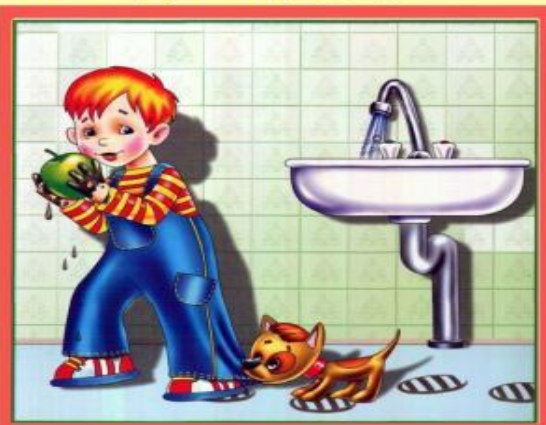
Мойте руки перед едой