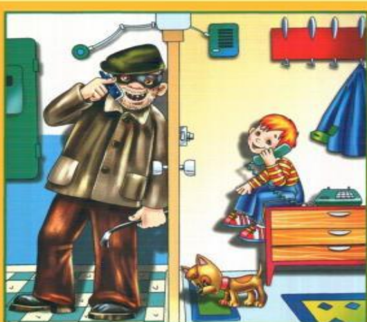
Не разговаривай и не открывай дверь незнакомым людям